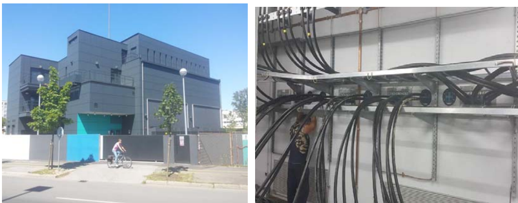
Slika 5. TS 110/10(20) kV Ferenščica

Kod izgradnje TS 110/10(20) kV Ferenščica korišteno je 40 okruglih brtvi te 6 kvadratnih okvira za ugradnju većeg broja modula raznih dimenzija (Slika 5.).