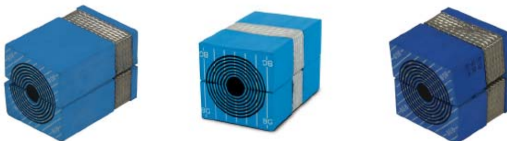
Modul BG B

c) CM BG B modul je namijenjen za završetke i prolaze gdje je zaštita okruženja zahtijevana samo s jedne strane i to za kompaktne okvire