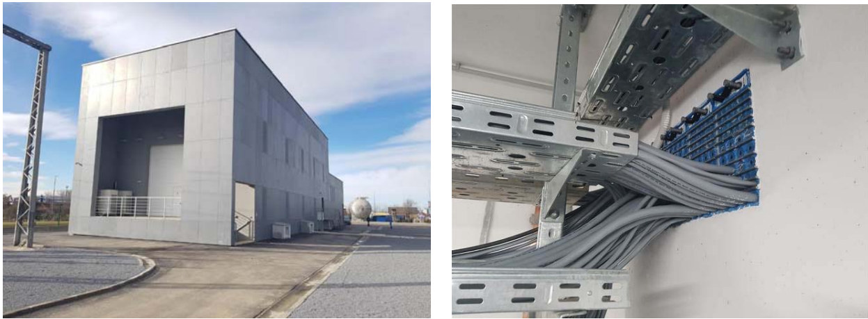
Slika 7. TS 110/10(20) kV Kutina

Kod rekonstrukcije TS 110/10(20) kV Kutina (Slika 7.) tijekom 2017. godine korišteno je 25 kvadratnih okvira ubetoniranih u oplatu, uključujući EMC module ispod GIS postrojenja, za razne izvedbe NN kabela s dodatnom električnom zaštitom te 85 okruglih brtvi za razne druge kabele.