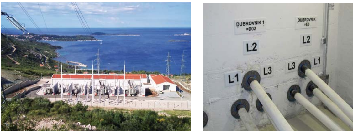
Slika 6. TS 220/110/35/20(10) kV Plat