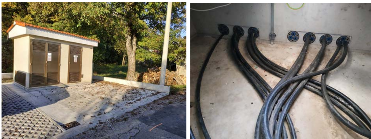
Slika 15. KTS Studena Rijeka