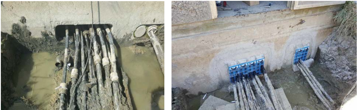
Slika 10: TS Beketinci, prije i nakon sanacije, s ugrađenim modularnim brtvećim sustavom

I na ovom objektu korišten je modularni brtveći sustav (Slika 10.) gdje je su ugrađena 3 kompleta brtvećeg sustava kojim je omogućena vodotjesnost i brtvljenje postojećih kabela uz fleksibilnost, „on site” podršku te otpornost na male životinje.