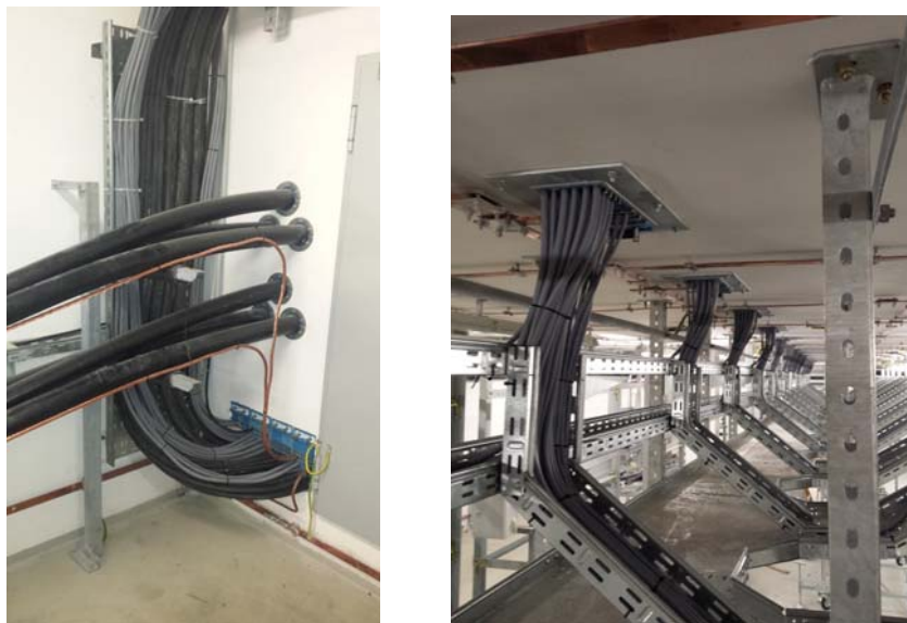
Slika 11. TS 220/110/35 kV Pehlin

Iako je prvobitnim projektom bilo predviđeno korištenje drugog sustava brtvljenja, prvenstveno zbog fleksibilnosti i mogućnosti reinstalacije zbog etapnosti projekta, iskustva instalatera i lokalne podrške, za rekonstrukciju TS 220/110/35 kV Pehlin (Slike 11.) izabran je modularni sustav brtvljenja te je ugrađeno 39 modularnih brtvećih kompleta kojim je postignuta vodotjesnost i protupožarnost u tom objektu.