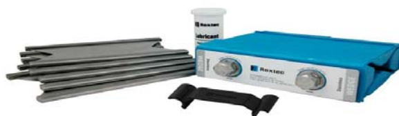
Slika 3. Nivelacijske pločice i kompenzacijski klin

Na vrhu svakog završenog reda modula umeću se nivelacijske pločice dok se na vrh svih modula, uz gornji rub okvira, postavlja kompenzacijski klin. U kompenzacijskom klinu nalaze se dva vijka koji se zatežu do kraja navoja. Po završetku montaže spojnica kompenzacijskog klina pričvršćuje se na vijke kompenzacijskog klina kako bi se provjerila pravilna zategnutost samog kompenzacijskog klina (Slika 3.). Demontaža se obavlja obrnutim redoslijedom od instalacije.