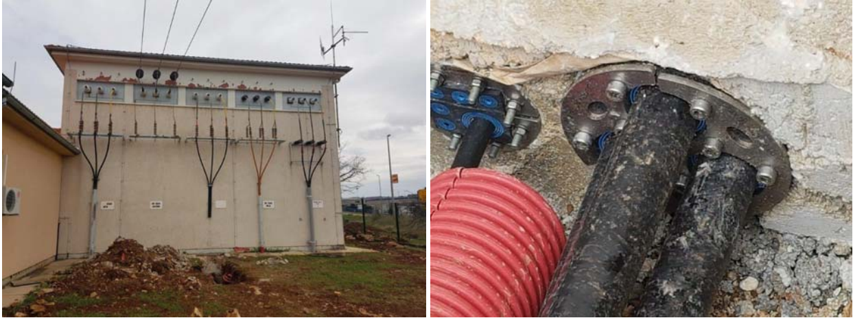
Slika 13. TS 110/35 kV Buje

U TS 110/35 kV Buje predviđeno je bilo uvađanje novog transformatora pa je projektant predvidio rješenje ugradnjom 3 modularna brtveća kompleta (Slika 13.).