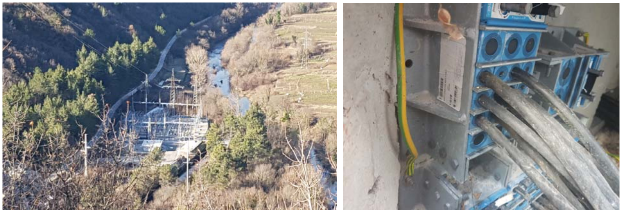
Slika 14. TS 110/35 kV Kraljevac

U ovom objektu traženo je da upotrebljeni brtveći sustav zadovolji protupožarne zahtjeve na kabel, fleksibilnost, mogućnost dodavanja i zamjene novih kabela, te su korištena iskustva instalatera upotrebom modularnih brtvećih sustava. Za ovaj objekt korišteno je 13 modularnih brtvi (Slika 14.).