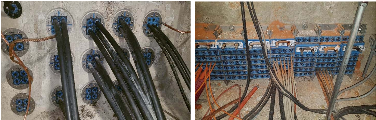
Slika 9. TETO Zagreb

Projekt izgradnje nove TS 110/30/10(20) kV ELTO ZAGREB bio je tek dio projekta novog 150 MW proizvodnog bloka u ELTO-u (Slika 9.). Montaža je započeta u rujnu 2018. prilagođavanjem otvora i uklanjanja opreme te kabela, instalacijom novih kabela, lijevanjem kalupa i ugradnjom modularnih brtvećih elemenata predviđenih projektnom dokumentacijom te svim ostalim radnjama za instalaciju, kontrolu i puštanje u rad predviđenih 77 raznih modularnih brtvećih kompleta.